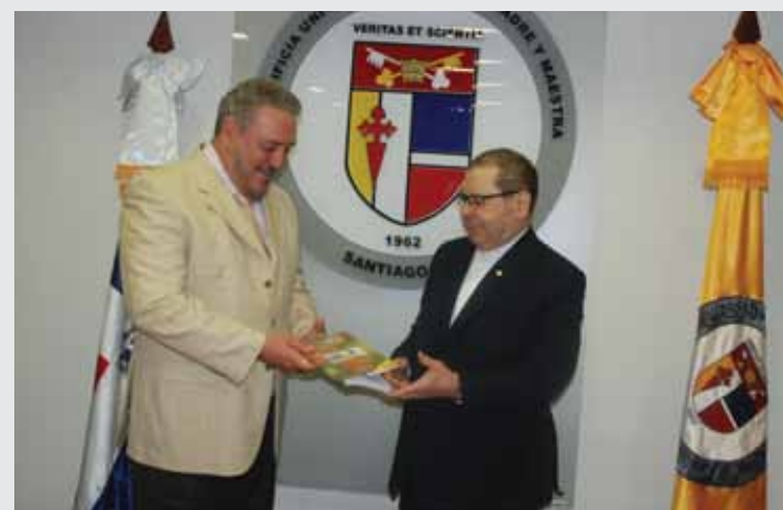
Monseñor Núñez Collado entrega un presente a Castro Díaz.

Lo que hace Cuba es una rectificación de su modelo económico a partir de cuestiones que son inexplicables en el contexto de la banalización mundial y de la receta que siempre nos quieren dar. Hace 20 años que desapareció la Unión Soviética, sin embargo nuestra nación está muy fuerte y lleva 50 años con un bloqueo que nos ha costado recursos y vidas. No tenemos fórmulas ni tenemos recetas que nos indiquen cómo desarrollar un país bloqueado, Cuba siempre ha estado dispuesta a negociar en igualdad de condiciones. La democracia se inventó en Grecia y era para los ciudadanos libres no para los esclavos. Lo que vemos es agresión por todos los lados y recetas de cómo debemos comportarnos todos para parecernos a ellos (se refiere a Estados Unidos). ¿Cómo va a transitar Cuba? Un científico norteamericano decía: "La mejor manera de predecir el futuro es inventándolo". Nosotros estamos haciendo eso, inventando el futuro de Cuba.