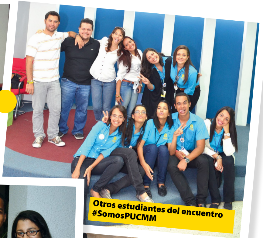
Otros estudiantes del encuentro #SomosPUCMM