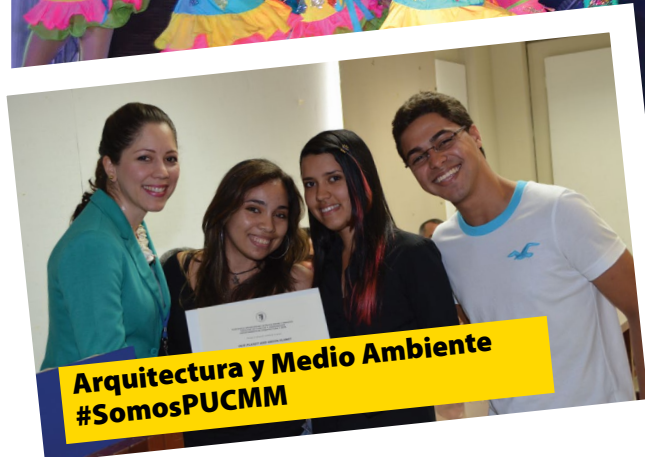
Arquitectura y Medio Ambiente #SomosPUCMM