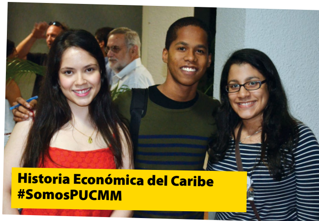
Historia Económica del Caribe #SomosPUCMM