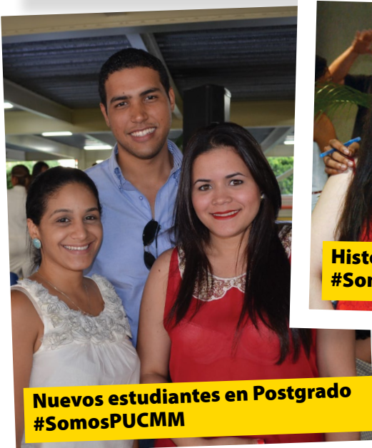
Nuevos estudiantes en Postgrado #SomosPUCMM