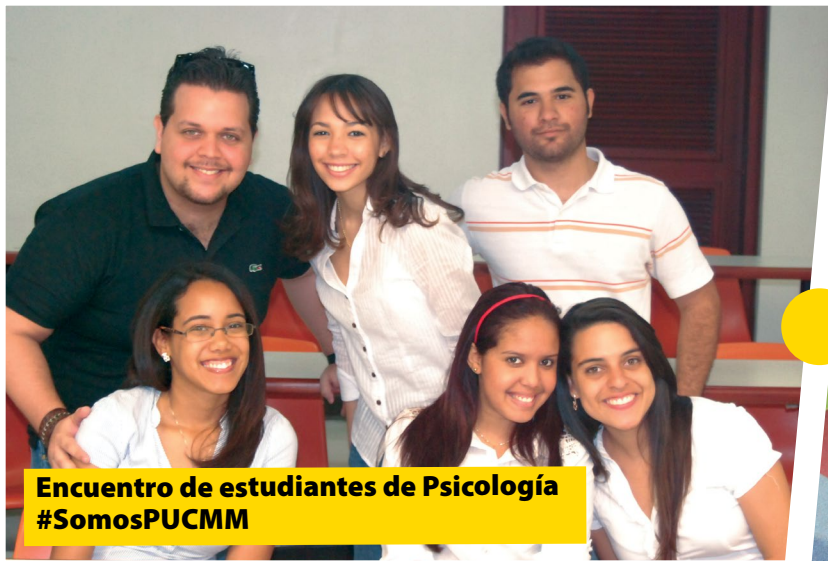
Encuentro de estudiantes de Psicología #SomosPUCMM

Usa este hashtag y cuéntanos por qué eres @PUCMM