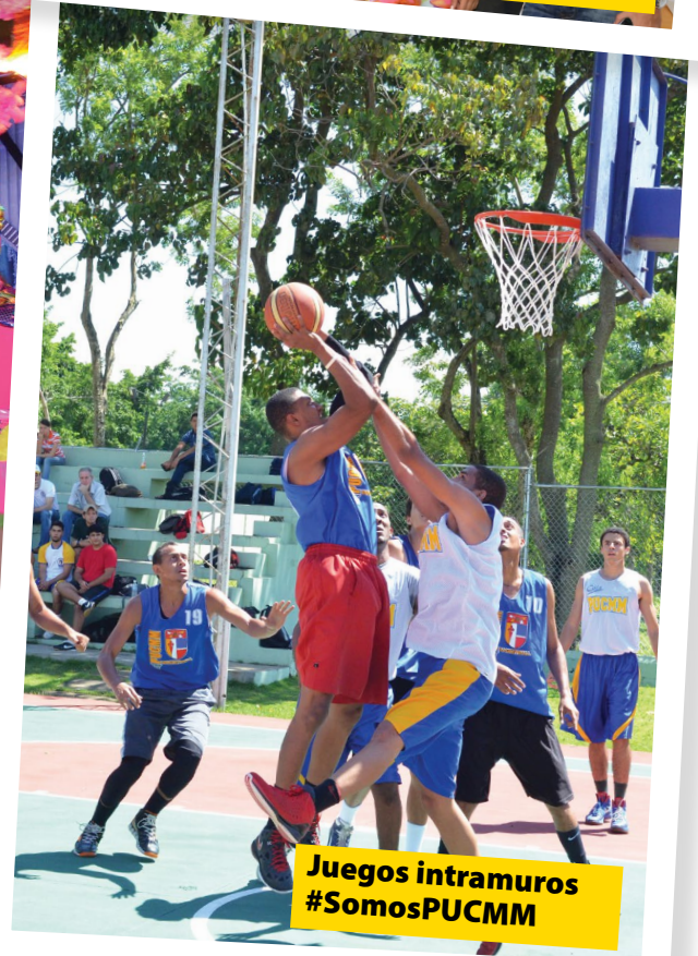
Juegos intramuros #SomosPUCMM