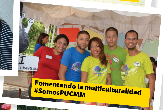
Fomentando la multiculturalidad #SomosPUCMM