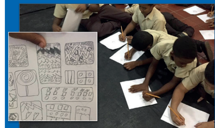
Taller Creando historias a través de imágenes