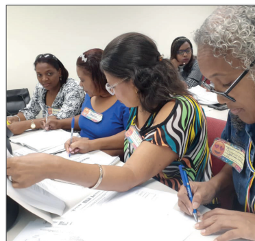
Técnicos regionales y distritales de la Regional 10 durante la jornada formativa de Matemática

Secuencias Didácticas a fin de mejorar la práctica áulica en las escuelas. En el segundo taller, realizado el 16 de octubre, enfocado al área