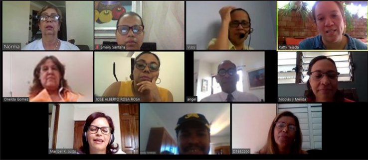
Equipo técnico da seguimiento a los proyectos del CIEDHumano