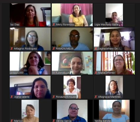
Encuentro del componente curricular del área de Matemática

Trabajamos desde casa y usando recursos virtuales estamos mucho más comprometidos con la educación y el desarrollo humano.