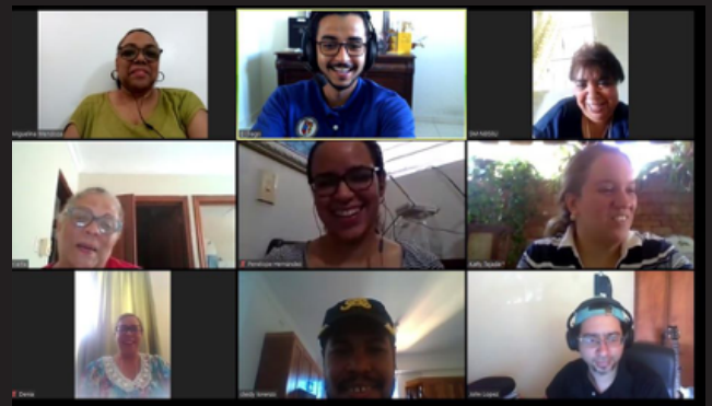
Reunión de seguimiento a los proyectos EPIFANÍA y Fortalecimiento Relación-Escuela-Familia y Comunidad en el Distrito Educativo 08-08