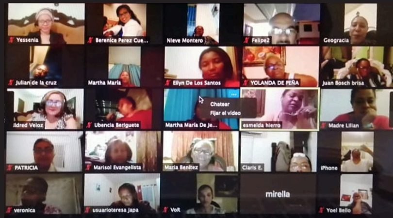
Reunión de directores equipo Distrito 10-06