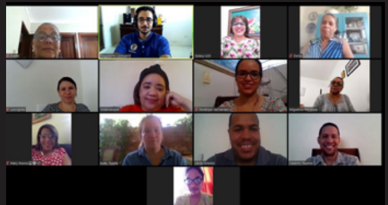
Reunión ampliada con integrantes del Componente de Gestión, de Desarrollo Humano y la Unidad de Comunicación del CIEDHumano, facilitadores y representantes del Distrito Educativo 08-08 para dar seguimiento a los proyectos EPIFANÍA y Fortalecimiento Relación-Escuela-Familia y Comunidad en el Distrito Educativo 08-08