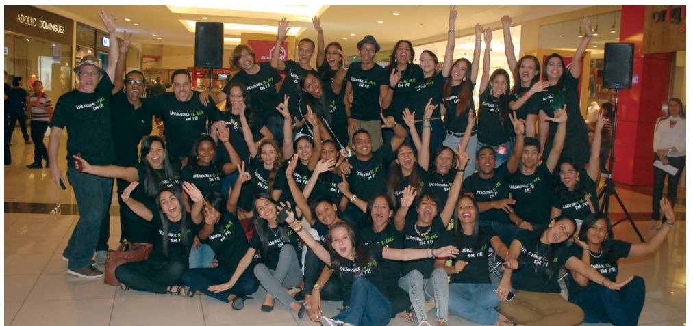
¡Espacios vivenciales del arte! #SomosPUCMM