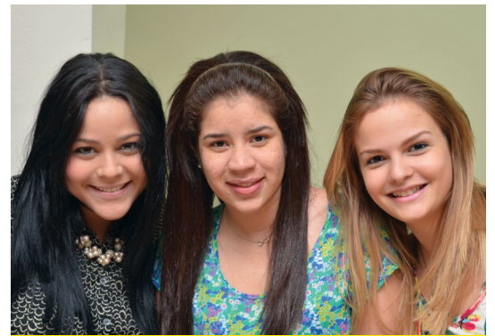
En Marketing Deportivo #SomosPUCMM