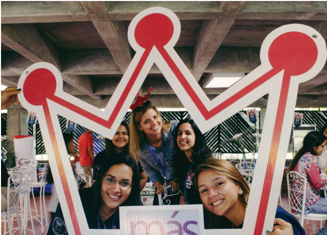
Feria Más Marketing Content is King #SomosPUCMM

Usa este hashtag y cuéntanos por qué eres @PUCMM