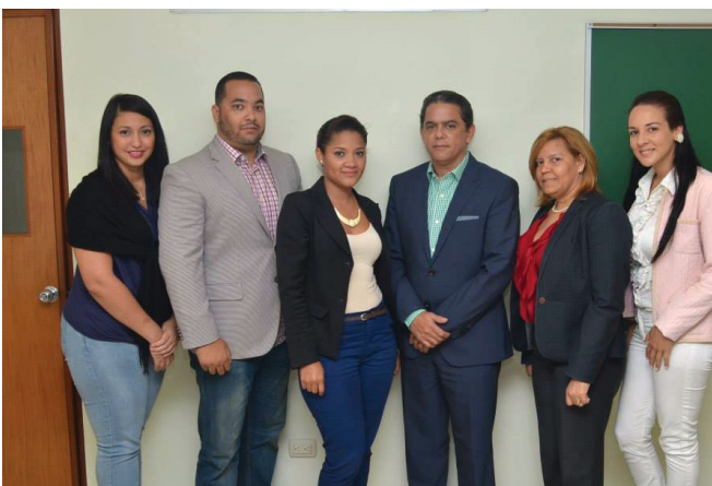
Las relaciones internacionales en RD #SomosPUCMM