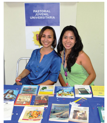
Intercambia un libro #SomosPUCMM