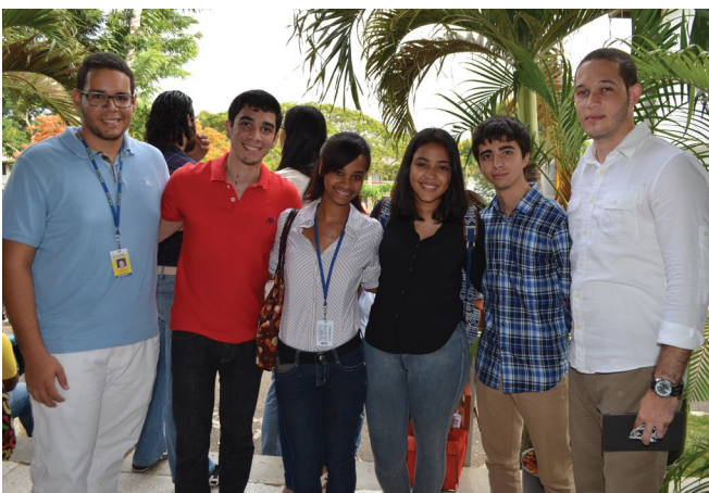
Charla de verano Ingeniería Industrial #SomosPUCMM