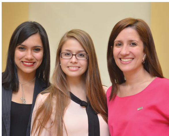
Mercado Asegurador #SomosPUCMM