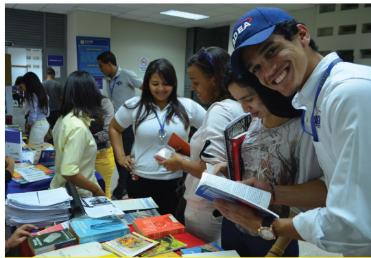
Vive la lectura! #SomosPUCMM