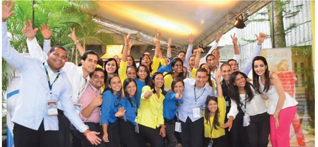
Nosotros tenemos SED de una mejor sociedad, y tú, ¿de qué tienes sed? #SomosPUCMM