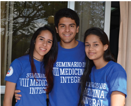
VIII Seminario Medicina Integral #SomosPUCMM