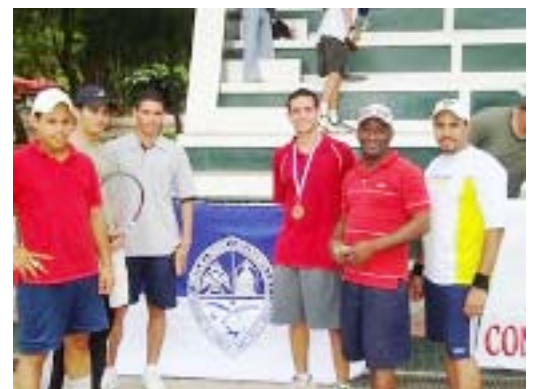
Atletas de la UASD, quienes lograron el segundo lugar.