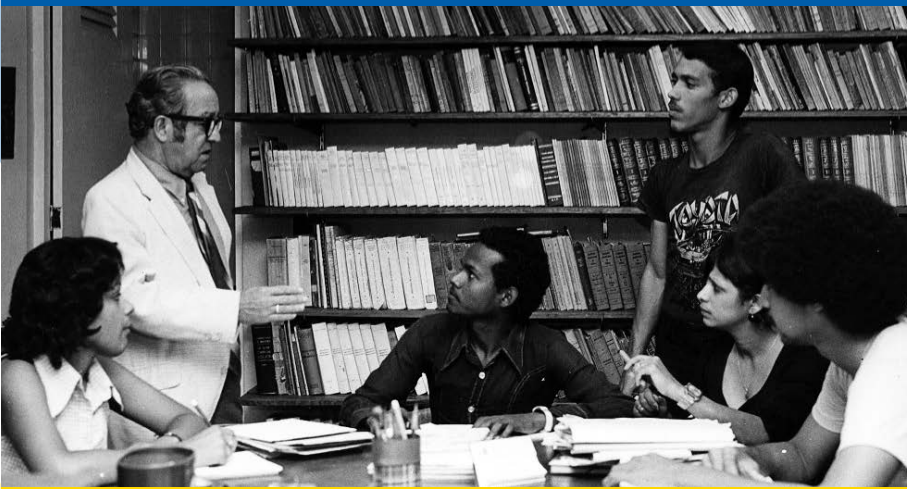
UNA CONVERSACIÓN PARA LA HISTORIA. El poeta y escritor Héctor Incháustegui Cabral conversando con un grupo de estudiantes en la biblioteca de su residencia en el campus universitario de Santiago. Década 1970.