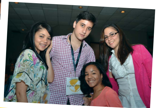
Seminario Internacional Gestión Financiera #SomosPUCMM