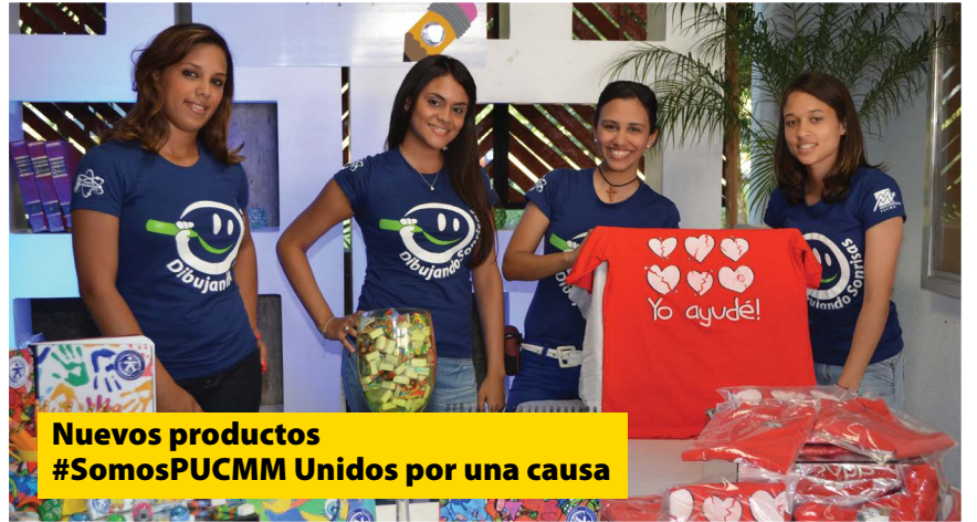
Nuevos productos #SomosPUCMM Unidos por una causa