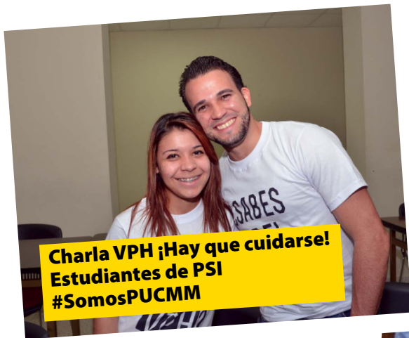
Charla VPH ¡Hay que cuidarse! Estudiantes de PSI #SomosPUCMM