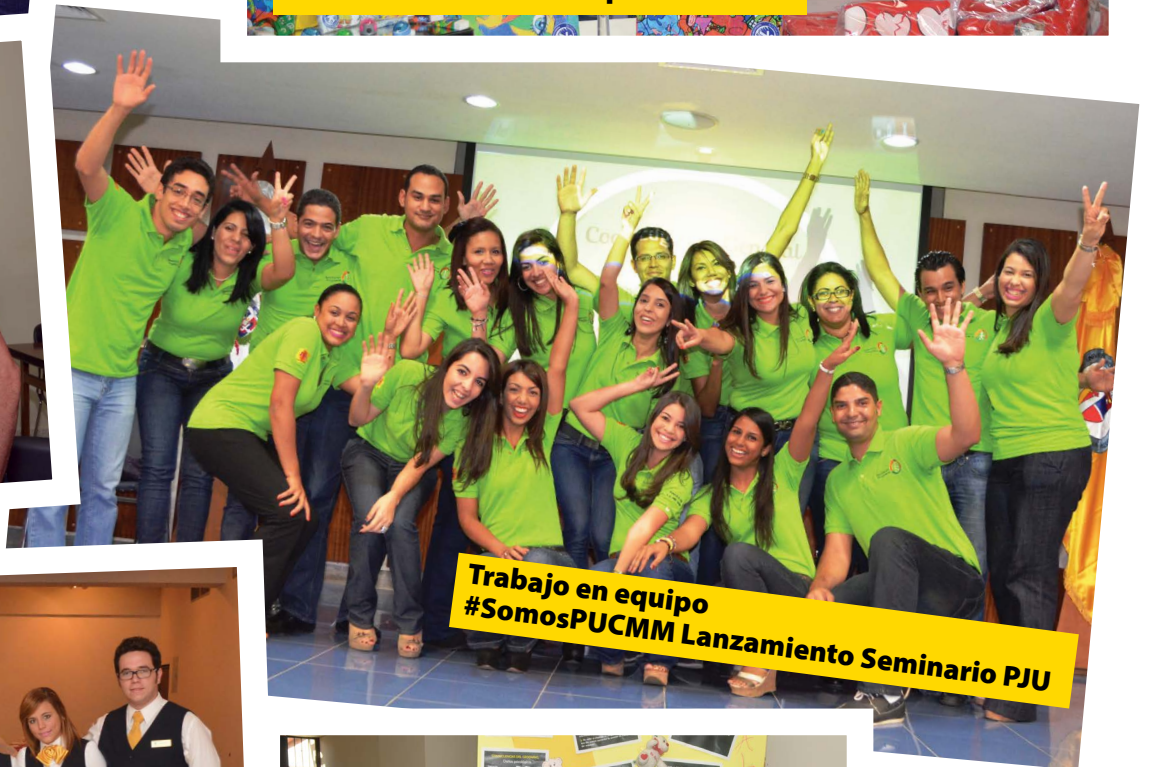
Trabajo en equipo #SomosPUCMM Lanzamiento Seminario PJU