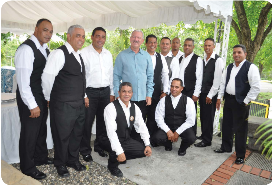
Santana y su equipo de trabajo.