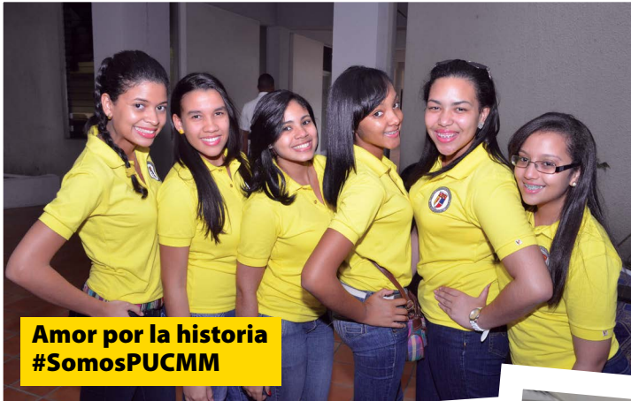
Amor por la historia #SomosPUCMM

Usa este hashtag y cuéntanos por qué eres @PUCMM