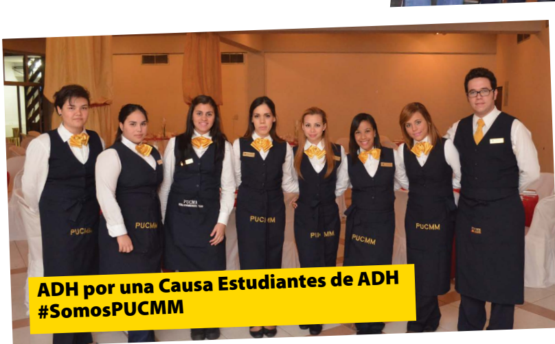
ADH por una Causa Estudiantes de ADH #SomosPUCMM