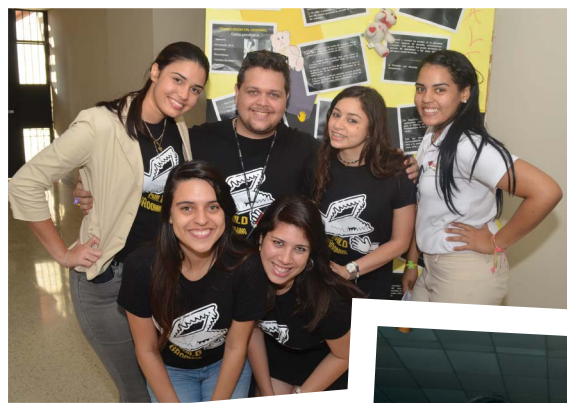
Psicología informando sobre el Grooming #SomosPUCMM