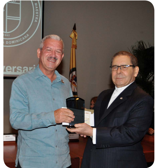
Reconocimiento por sus 33 años de servicio.