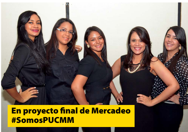
En proyecto final de Mercadeo #SomosPUCMM