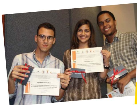
Santiago Suena Bien #SomosPUCMM Ganadores del 1er. Lugar