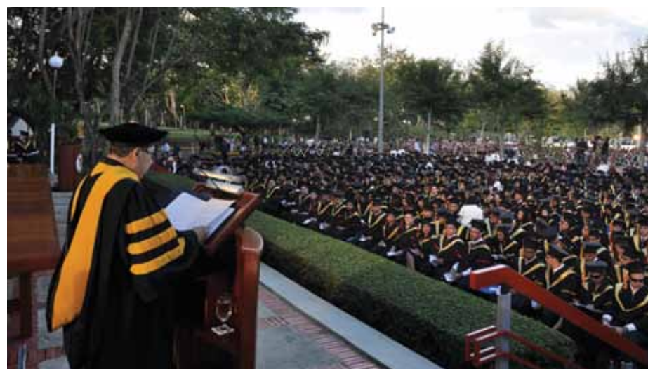
Los más de 62 mil egresados representan el mayor logro alcanzado por la PUCMM en su 50 años de fundada.

Las consideraciones expresadas por los obispos dominicanos y los resultados de los últimos estudios realizados para medir el posicionamiento de la Universidad, reflejan los logros alcanzados por la institución y la extraordinaria importancia que ha tenido y tiene para la sociedad.