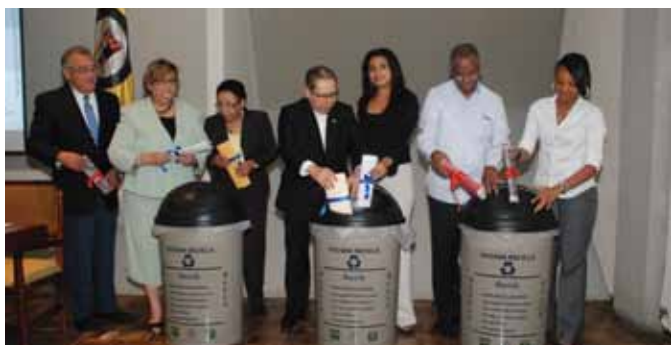
En una primera etapa se reciclará papel y cartón.

PUCMM RECICLA se trabajará con la colaboración del CEDAF y la empresa Moldeados Dominicanos, los cuales se encargarán de coordinar la logística de recolección final de los materiales reciclados, proporcionar bolsas plásticas para coleccionar el material, y facilitar un entrenamiento sobre el reciclado, sus ventajas y propósitos.