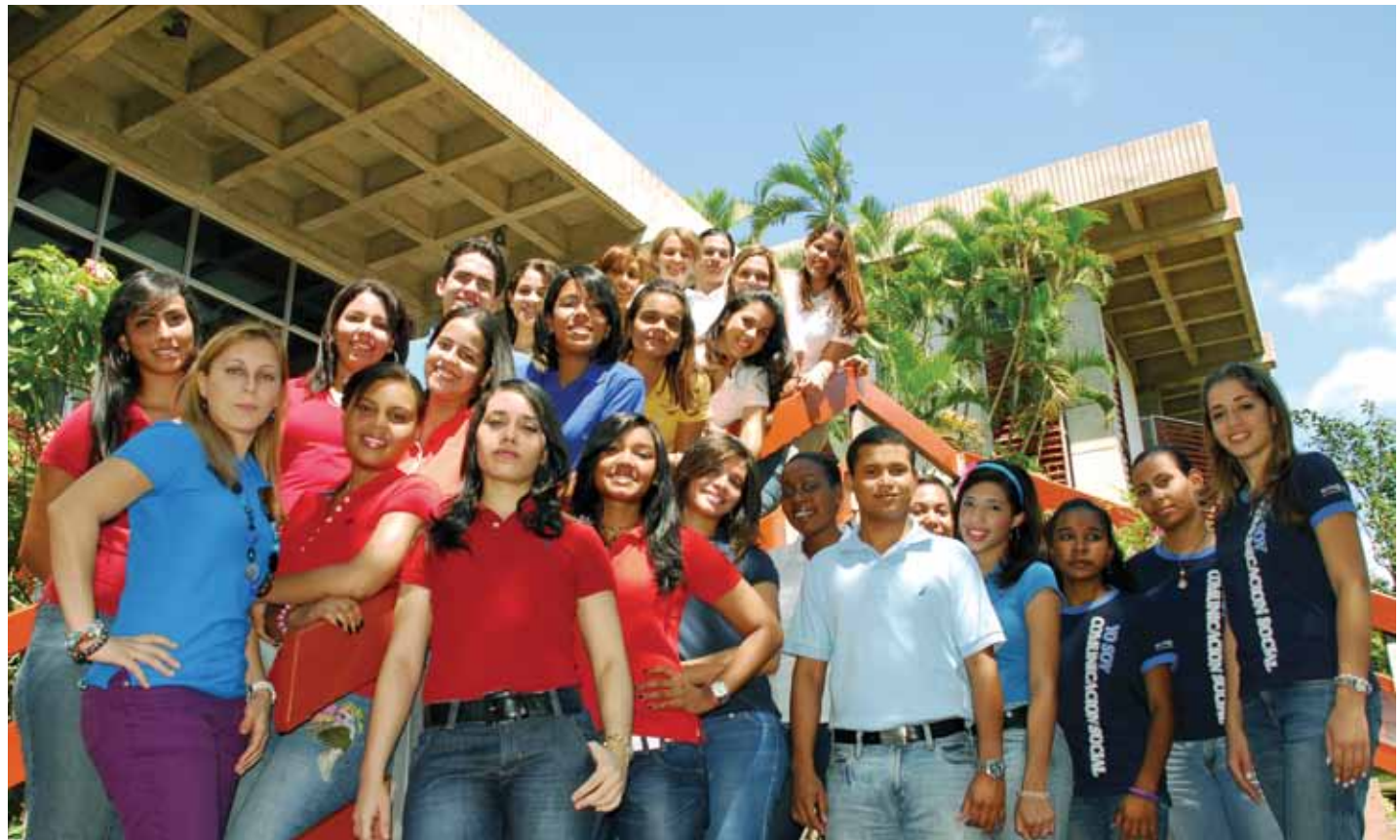
Estudiantes que ganaron 25 medallas de competencias nacionales e internacionales en las áreas de Hotelería, Derecho, Arquitectura y Comunicación Social.

2010 Reconocimiento a la Pontificia Universidad Católica Madre y Maestra, otorgado por la Confederación Panamericana de Escuelas de Hotelería, Gastronomía y Turismo