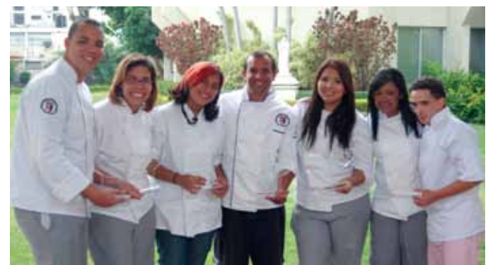
Los estudiantes de ADH ganaron 8 premios en el Festival Gastronómico de la Universidad Católica de Santo Domingo.