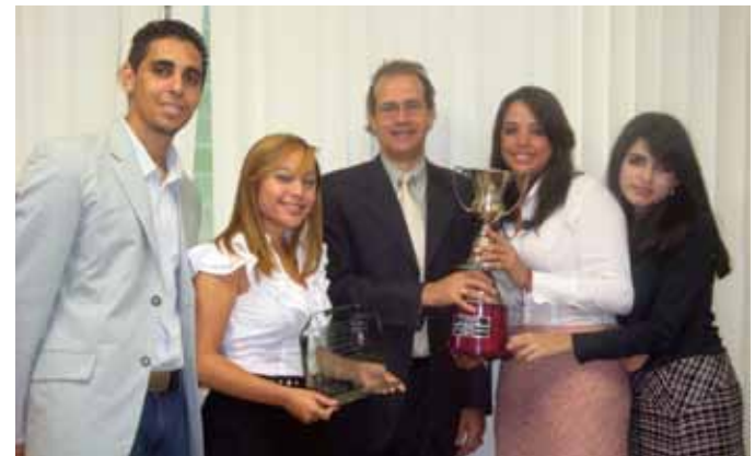
Estudiantes de Derecho obtuvieron el primer lugar y el galardón a Mejor Escrito de Defensa en la competencia "Víctor Carlos García Moreno Procedimiento ante la Corte Penal Internacional".

2012 La PUCMM se convirtió en la principal ganadora del "Primer Festival Gastronómico Interuniversitario: La Vega, orgullo de mi tierra", de la Universidad Católica de Santo Domingo, al obtener ocho premios en las categorías carnes, aves, frituras, sándwiches y cafeterías, le-gumbres y postres.