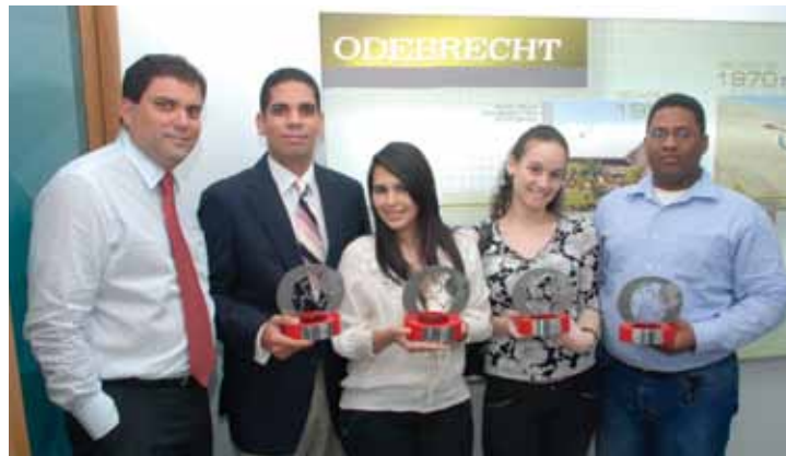
Estudiantes de Ingeniería Industrial de la PUCMM, ganaron el tercer lugar del Premio Odebrecht por el proyecto "Energía solar para la solución del problema energético en RD".

(CONPEHT), por "aunar esfuerzos a favor del crecimiento de la educación turística del país, lo que ha fortalecido la institucionalidad de la Confederación durante 20 años".